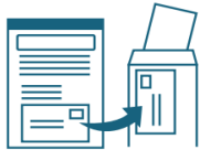
返信用宛名ラベルを封筒に貼付